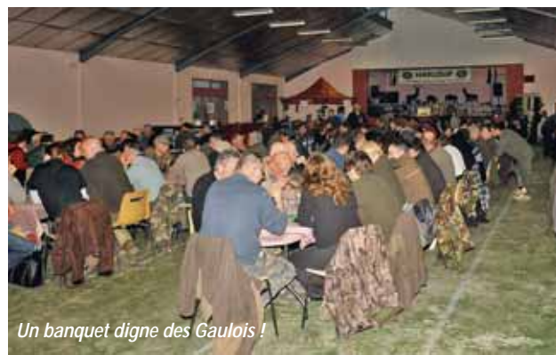
Un banquet digne des Gaulois !