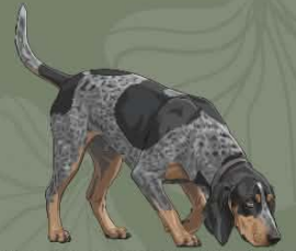
L'ensemble du bureau d'HARLOUP